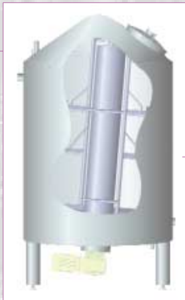
Kristallisatietank met onderaangedreven roerwerk

Postbus 62, 7200 AB Zutphen, Nederland Oostzeestraat 6, 7202 CM Zutphen, Nederland T: +31 575 593 100 F: +31 575 593 111 I: www.terlet.com E: info@terlet.com